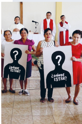
Aktion der Organisation Pro-Búsqueda, El Salvador 2019