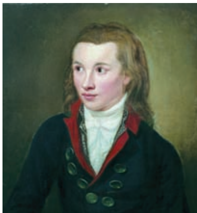
Der Ingenieur und Dichter Novalis