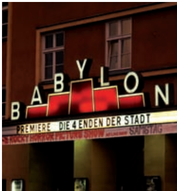
Kino am Rosa-Luxemburg-Platz

21. bis 28. August 2011 | Werkstatt-Woche in Berlin